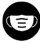
Medizinische Maske tragen